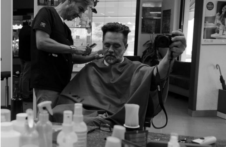
“Self-portrait at the barber shop”, 2017