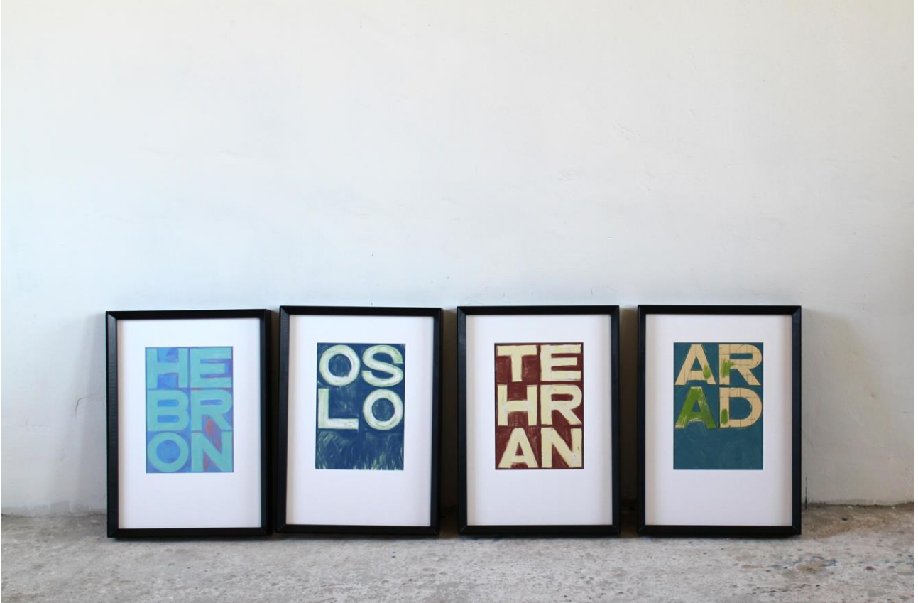
“City Names” , digital painting, inchiostro su carta, stampa dimensione 29,7 x 21 cm, supporto 50 x 35 cm, 6 esemplari numerati, 2018.