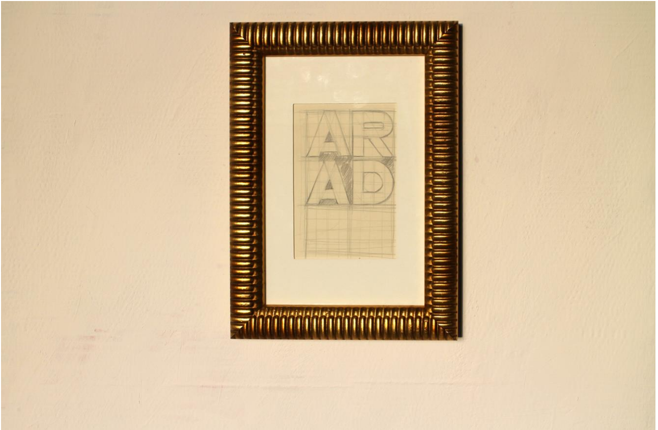
“Arad” , grafite su carta, 21 x 29,7 cm, 2018.