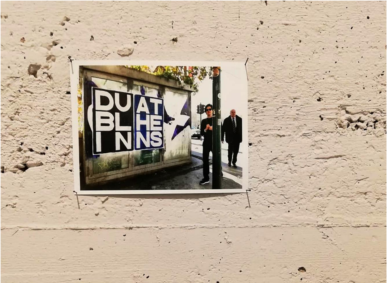
"Affissione" , Lungotevere de' Cenci, Roma, 2018.

Documentazione fotografica dell'azione di affissione sul Lungotevere de' Cenci, Roma dicembre 2018.