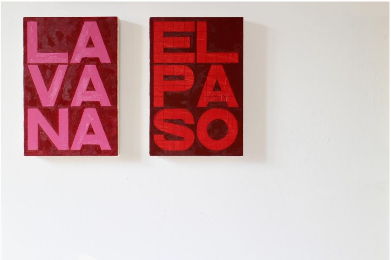
“L'Avana, El Paso”, city names, olio su tela, 32 x 21,5 cm, 2018/2019.