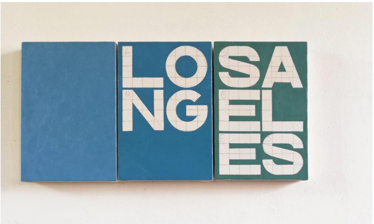
“Los Angeles” , city names, colori ad olio, tela di cotone, cm 32 x 21,5 x 3, 2019