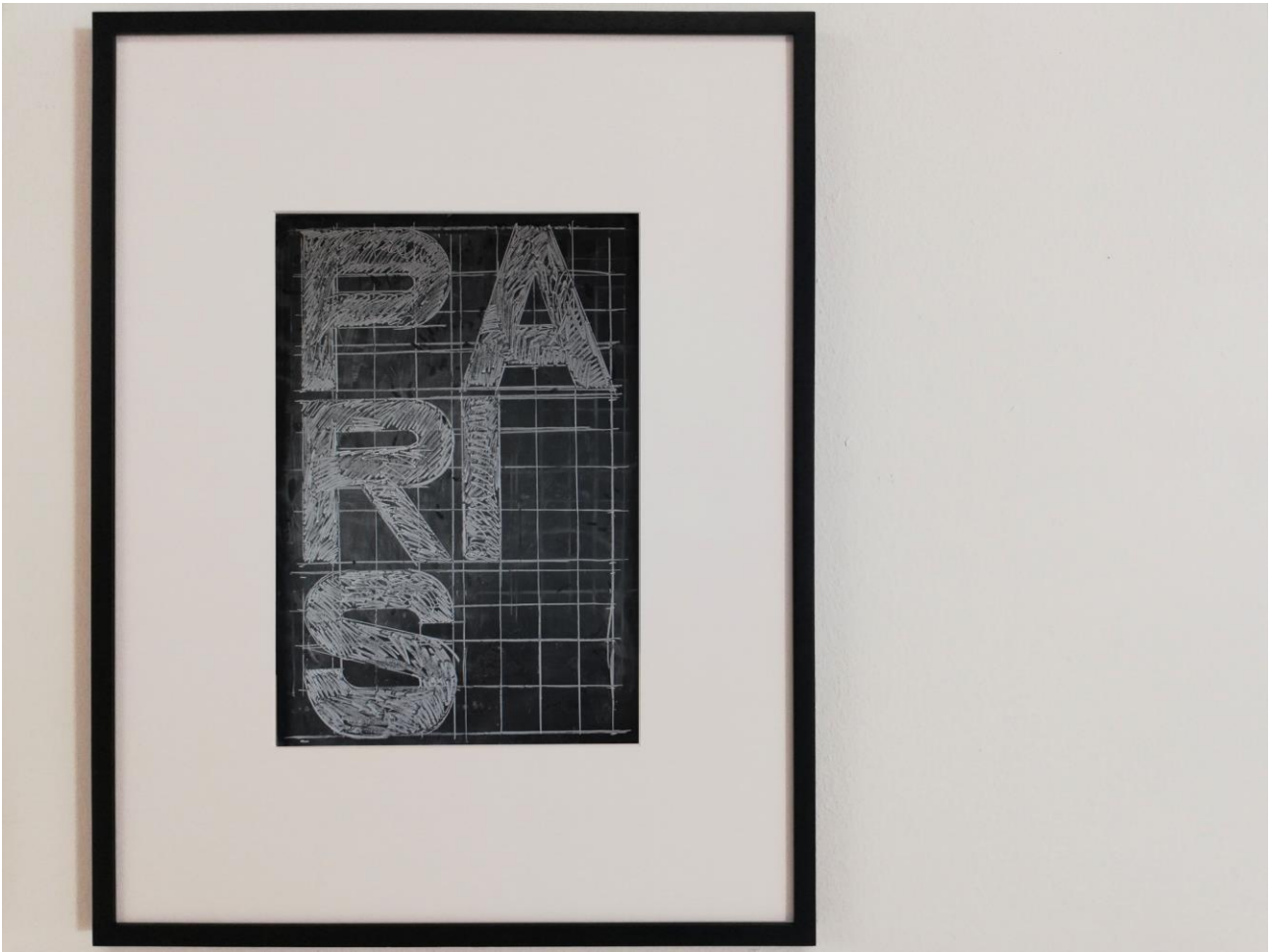
"Paris" , city names, Fotografía, 50 x 35 cm, gesso su lavagna, 2019.