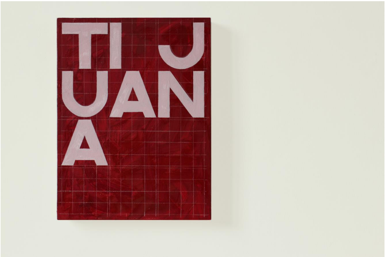
“Tijuana” , city names, olio su tela, 43 x 32 cm, 2019.