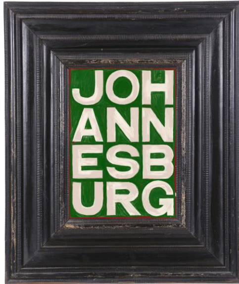
“Johannesburg” , city names, olio su tela, 43 x 32 cm, 2018.

www.tizianobellomi.it tizianobellomi@gmail.com