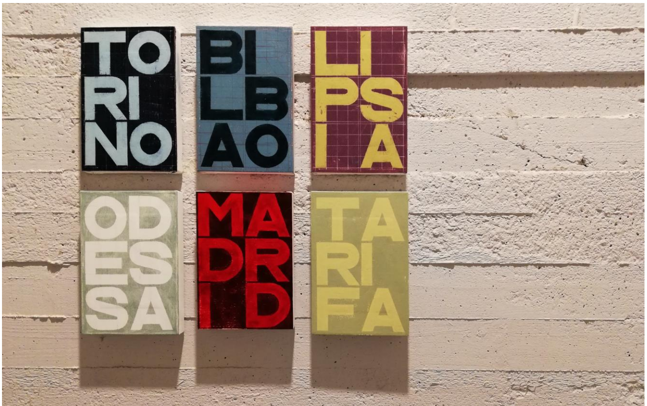
“City names”, Installazione, n° 6 dipinti 31 x 21 cm, olio su tela, 2018.

Presente alla mostra collettiva “Io sono un artista”, a cura di Piero Gagliardi e Giuseppe Capparelli, Casa d’Aste BOLLI&ROMITI, Roma 2018 - 2019