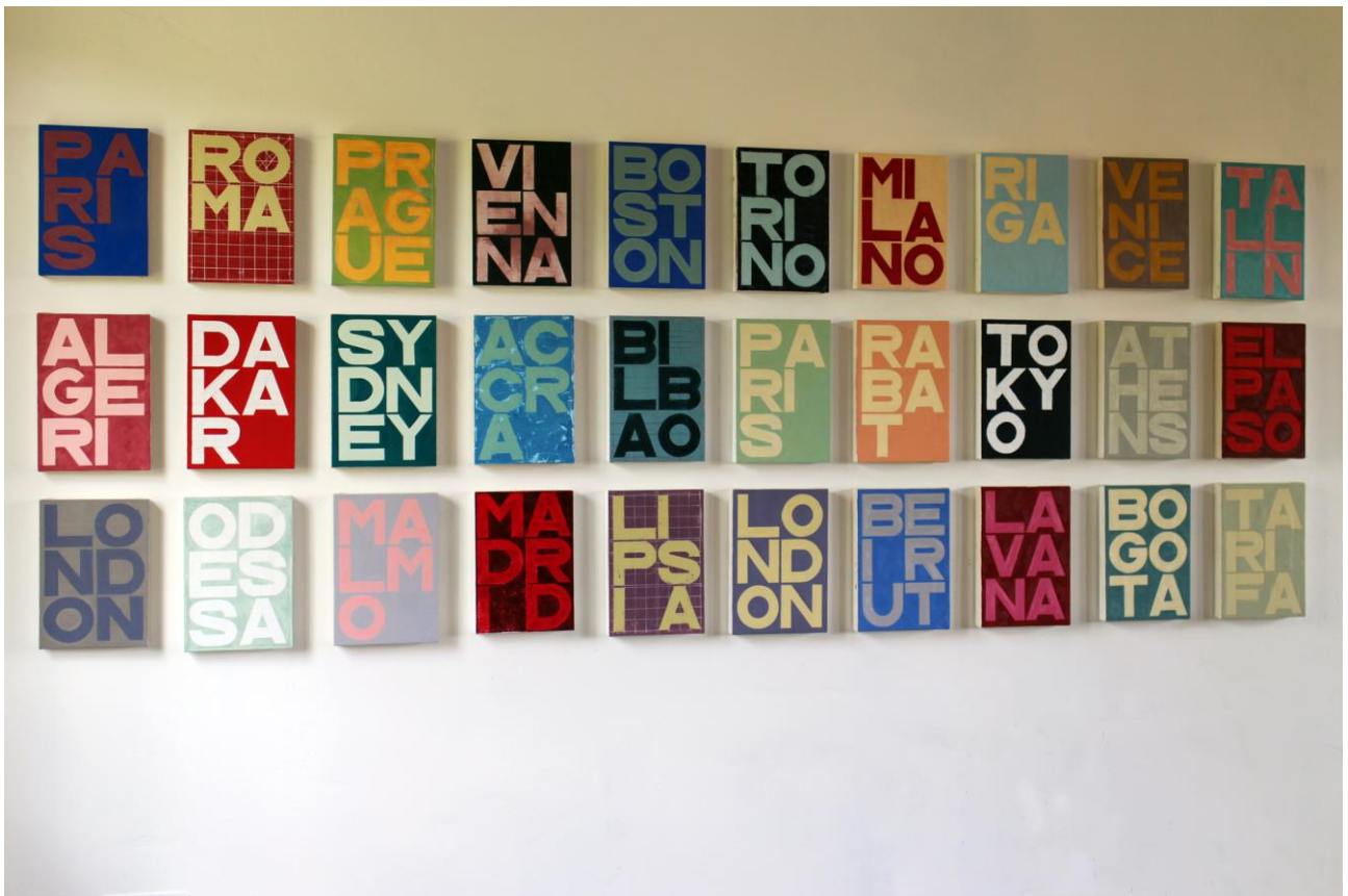
"City names" , Installazione, n° 30 dipinti 31 x 21 cm, olio su tela, 2017 - 2018 - 2019.