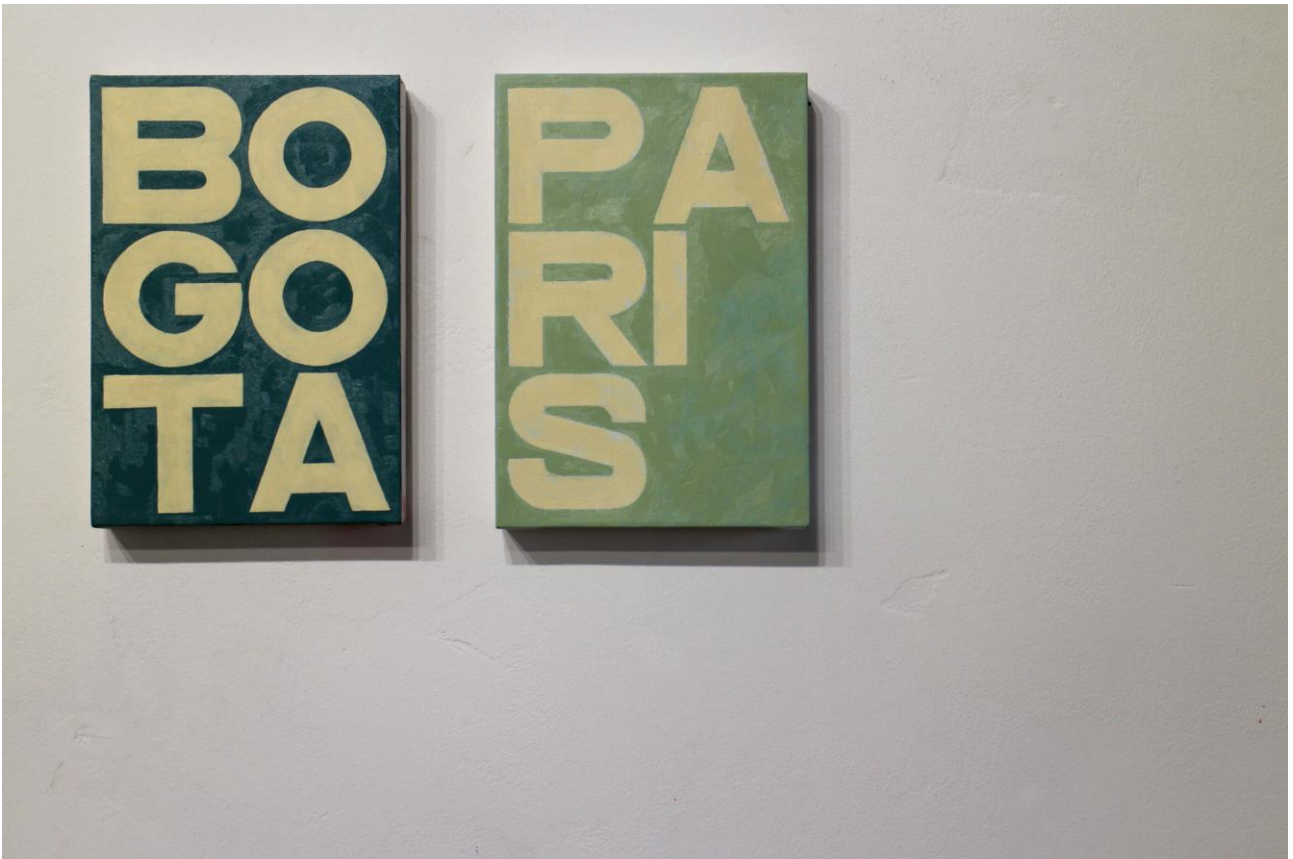
“Bogotà”, “Paris”, city names, 31 x 21,5 cm, olio su tela, 2018.